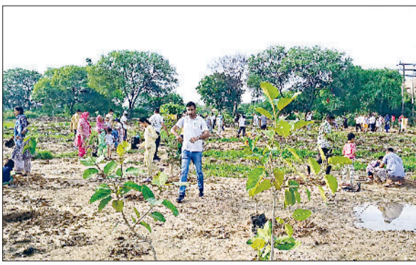
बहादुरगढ़। सेक्टर-12 की ग्रीन बेल्ट को हरा-भरा बनाने में जुटे पर्यावरण प्रेमी।

क्लीन एंड ग्रीन ट्रस्ट की पहल पर रविवार को शहर के विभिन्न सामाजिक संगठनों ने सेक्टर-12 की ग्रीन बेल्ट में 450 से अधिक पौधे लगाकर पर्यावरण संरक्षण का अनमोल संदेश दिया। दरअसल, क्लीन एंड ग्रीन ट्रस्ट बोते कई वर्षों से बहादुरगढ़ में हरियाली बढ़ाने की अलख जगा रहा है। उनके द्वारा शहर में कई हरियाली साइट्स विकसित की जा चुकी हैं। पर्यावरण संरक्षण की दिशा में