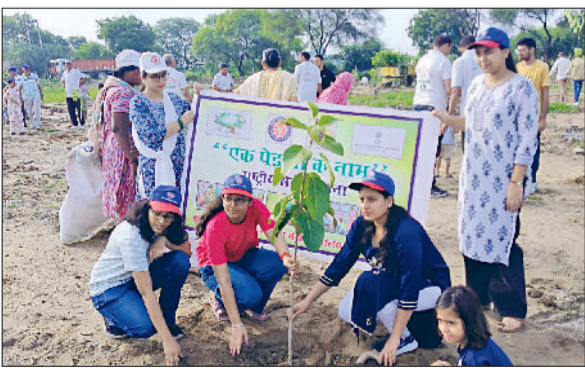
बहादुरगढ़। ऑटो मार्केट के निकट पौधे लगाती स्वयंसेविकाएं।

उठाए गए सामूहिक प्रयास में वन विभाग, सार्थक सेवा समिति, क्लीन अभियान में बड़ी संख्या में बच्चों, महिलाओं और बुजुर्गों की भागीदारी रही। कार्यक्रम की शुभारंभ राष्ट्रमान के साथ हुई। वन विभाग की ओर से पौधे और गड्डों की व्यवस्था की गई। सार्थक सेवा समिति द्वारा पौधों की सुरक्षा के लिए तारबंदी कराई गई।