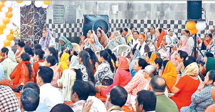
झज्जर। पंजाबी धर्मशाला में सुंदरकांड का पाठ श्रवण करते हुए श्रद्धालु।