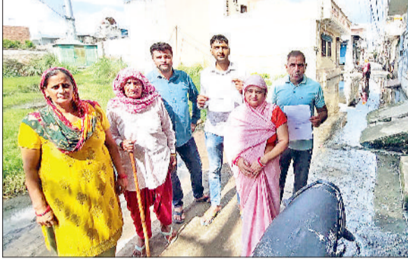
झज्जर। सीएम विंडो पर लगाई गई शिकायत के साथ कॉलोनीवासी।

जिस कारण अधिकांश लोगों द्वारा इसे शॉटकट के रूप में भी उपयोग किया जाता है। नियमित सफाई व गली का लेवल ऊंचा न होने के कारण नालियों का पानी हर समय गली में जमा रहता है। घरों के आगे गंदा पानी भरा होने के चलते जहां छोटे बच्चों व बड़े-बुजुर्गों के फिसलने का डर बना रहता है वहीं वे पूरा दिन बकबदूर माहौल में भी जीने को मजबूर हैं। कॉलोनी की महिलाओं का कहना है कि ऐसे में बच्चों के घर से बाहर जाने पर उन्हें विशेष निगरानी भी रखनी पड़ती है।