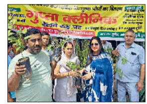
बहादुरगढ़। रेलवे रोड पर किया जा रहा पौधा वितरण।