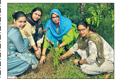
बहादुरगढ़। स्कूल परिसर में पौधे लगाते शिक्षक।