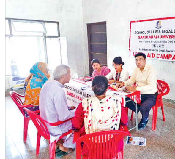
झज्जर। शिविर में पहुंचे लोगों को कानूनी परामर्श देते हुए विधि संकाय के शिक्षक।

■ विधिक जागरूकता ग्रामीण सशक्तिकरण की नींव ■ उनके संस्थान का उद्देश्य केवल शिक्षा तक सीमित नहीं अपितु समाज के प्रति उत्तरदायित्व को निभाना भी