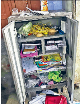
बहादुरगढ़। चोरों द्वारा खंगाली गई अलमारी।

इलाके में सरकारी स्कूल चोरों के निशाने पर हैं। अब दहकोरा गांव के राजकीय वरिष्ठ माध्यमिक विद्यालय व प्राथमिक पाठशाला में वारदात हो गई। दोनों स्कूलों से काफी सामान चुराया गया है। बीते चार महीने में यहां छठी बार चोरी की वारदात हुई है। बार-बार हो रही चोरी की वारदात सुरक्षा व्यवस्था पर भी सवाल खड़े कर रही है। वारदात शुक्रवार की रात को हुई थी।