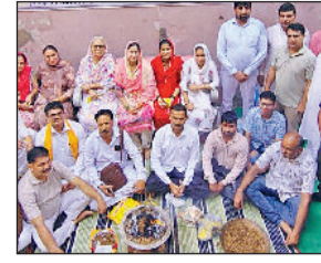
बहादुरगढ़। हवन में भाग लेते लोग।