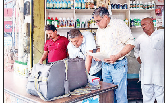
झज्जर। निरीक्षण के दौरान दुकान में मौजूद सीएम फ्लाइंग टीम सदस्य।

कृषि विभाग व सीएम फ्लाइंग टीम द्वारा रविवार को शहर में खाद एवं बीज की दुकानों का निरीक्षण किया गया। इस संयुक्त कार्रवाई में गुप्तचर विभाग व पुलिस बल भी शामिल रहा। इस दौरान फ्लाइंग टीम ने शहर के छिक्कारा चौक व पुराना बस स्टैंड रोड स्थित खाद एवं बीज वाली कई दुकानों में पहुंच कर बीज, खाद, दवाओं आदि के स्टॉक का रिकार्ड चेक किया। फ्लाइंग टीम सदस्यों द्वारा कुछ दुकानों से दवाओं के सैंपल में भी लिए।