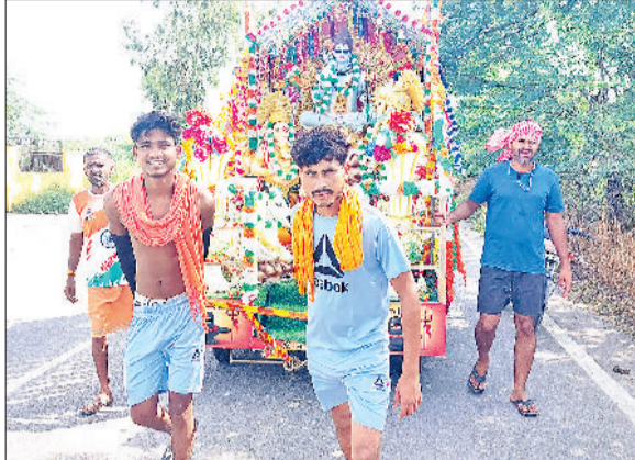
झज्जर। कांवड़ियों की सुरक्षा को लेकर पुलिस अलर्ट, लगाए विशेष नाके, निरंतर की जा रही गश्त