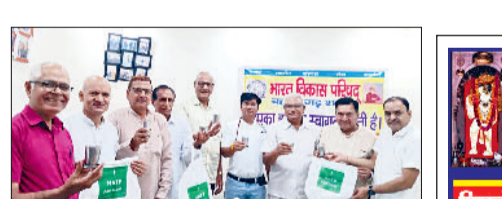
बहादुरगढ़। बैठक में चर्चा करते सीनियर सिटीजन क्लब के सदस्य।

सेक्टर-6 में स्थित सीनियर सिटीजन क्लब में रविवार को आम सभा की बैठक हुई। सरकार की तरफ से क्लब को आर्थिक मदद करवाने के लिए सबसे पहले विधायक राजेश जून का ध्वनिमत से धन्यवाद प्रस्ताव पास किया गया।