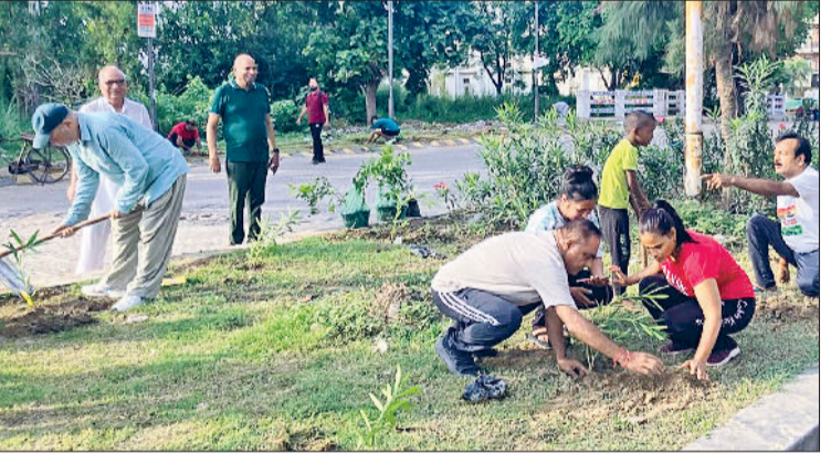
बहादुरगढ़। ओमेक्स परिसर में पौधे लगाते पर्यावरण प्रेमी।