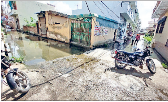
झज्जर। प्रिया कॉलोनी से लालचंद कालोनी जाने वाली दो गलियों में जलभराव।