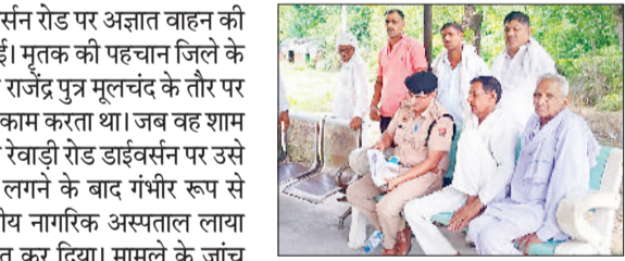
झज्जर। पोस्टमार्टम के लिए कामग्री कार्रवाई करते हुए पुलिसकर्मी।